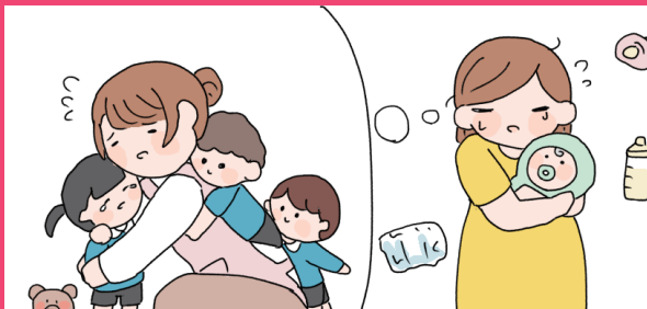
子供が保育園に入れない