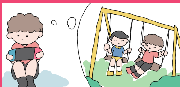
友だちと遊べる場所がほしい！