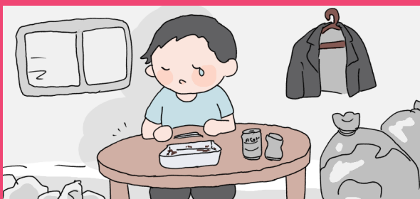
働いても働いても生活が苦しい