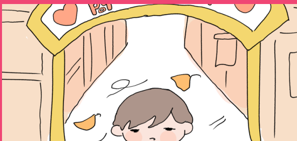
町に活気が欲しい