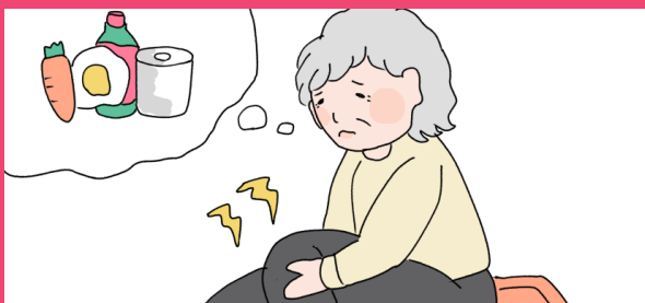
足が悪くて一人で買い物にいけない