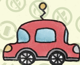
プラスチック製 おもちゃの車