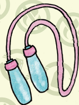
プラスチック製 なわとび