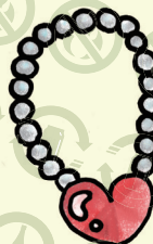
金属製 アクセサリー