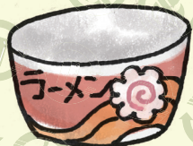
プラスチック製 カップ麺容器