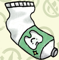
歯磨き粉チューブ