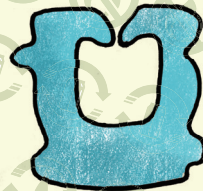
バッグ・クローザー